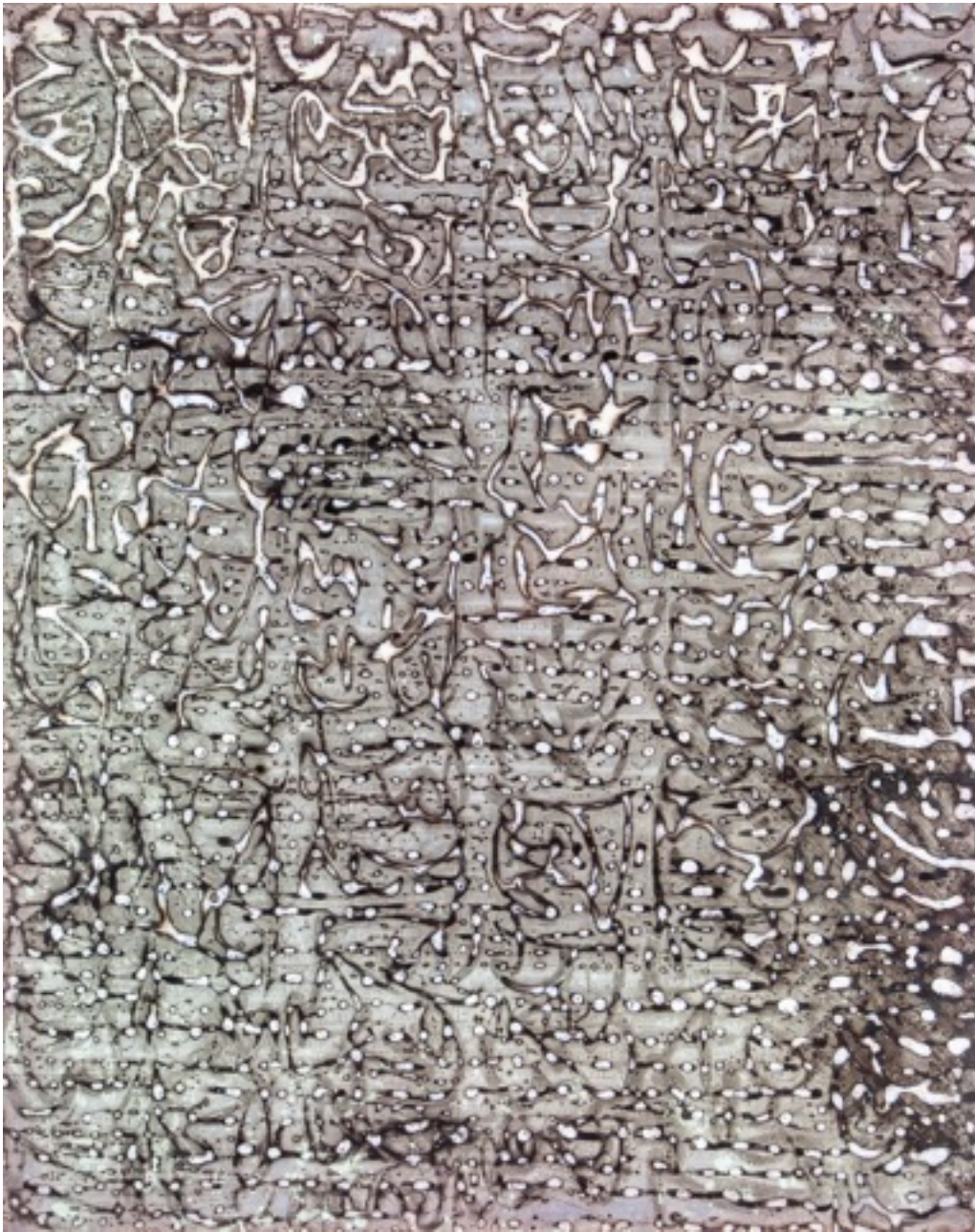
Emil Siemeister, Rhythmische Übungen (recto-verso), 1994, Chemie/Röntgenfilm F - 4 2 x 33,5 cm