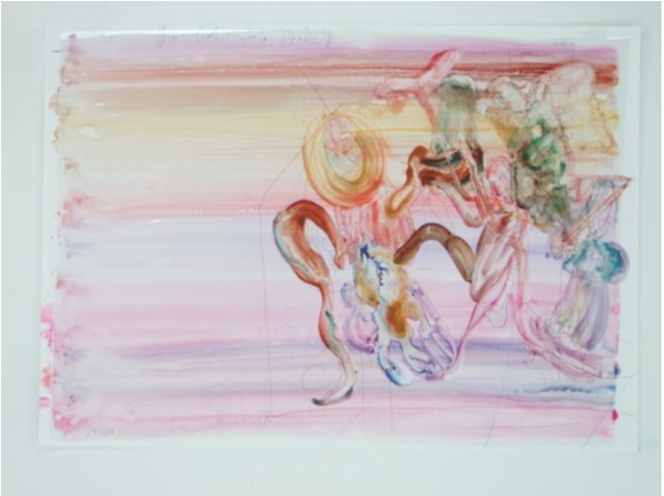
Emil Siemeister, Behauptetes Ballett , 2014, Wasserfarbe/Bleistift/Papier/Kunststoffolie F- 70 x 50 cm