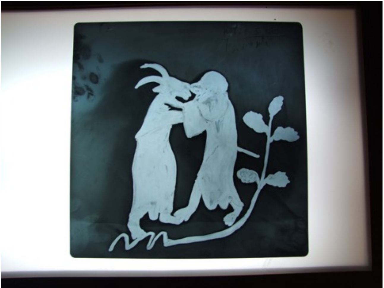
Emil Siemeister, The Placebo Macclesfield Psalter , 2010, Chemie/ Röntgenfilm F- 35,5 x 35,5 cm